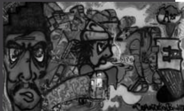
A-One - Communication breakdown (1990) Zie artikel 'Graffiti Art' blz 4

Dit beeld is overdreven, maar de 2.0-generatie heeft echter wel enorm veel keuzes. Zij kan zich op veel verschillende manieren informeren over wat er in de wereld gaande is, over waar hij naar toe wil die avond of wat hij kan aanschaffen. Via officiële sites van instellingen, bedrijven of kranten of juist via fora, blogs, communities. Hij kan gebruik maken van tekst, beeld (video en foto) of geluid (pod's) maar ook interactief bezig zijn met die informatie. Die 2.0-generatie blijkt overigens niet passief en ongeïnteresseerd.