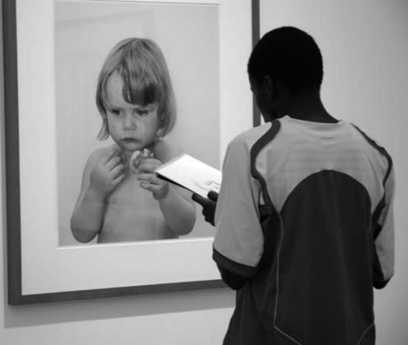
Maakt een andere manier van kunstbeleven Nieuwe Kunst? Fotograaf Saskia van der Linden uit de serie Kijken & Kijken: Kijken 2

keert, en geeft goede redenen om met elkaar in gesprek te gaan over onze waarden. De discussie over kwaliteit en smaak is een onderdeel van ons vak, maar bovendien: 'sprookjes, toneel, opera, romans, korte verhalen; biografiën, geschiedenis, etnografie; fictie en non-fictie; schilderkunst, muziek, beeldhouwkunst en dans: elke menselijke beschaving heeft manieren om ons waarden te laten zien die we daarvoor nog nooit gezien hadden, of om de toewijding aan de waarden waarmee we vertrouwd waren te ondergraven.' En dus is het samen bespreken van deze verhalen één van de centrale manieren om te leren onze reacties op de wereld af te stemmen. We leren er dus van.