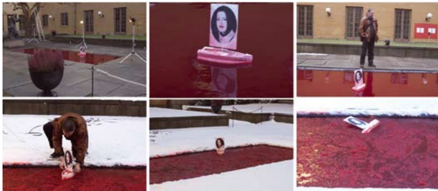
Installatie Snow White van Dror Feiler and Gunilla Sköld Feiler, Historiska Museet Stockholm.

De context: De installatie draagt de titel Snövit och sanningens vansinne (Sneeuwitje en de waanzin van de waarheid), is gemaakt door het Zweedse kunstenaars-echtpaar Dror Feiler en Gunilla Sköld Feiler (in de media aangeduid als 'Zweedse (maar in Israël geboren) componist en zijn Zweedse echtgenote, kunstenaars', en maakt tot half februari deel uit van de manifestatie 'Making Differences' van het museum, op haar beurt gelieerd aan de van 26 tot 28 januari in Stockholm plaatsvindende anti-genocide conferentie.