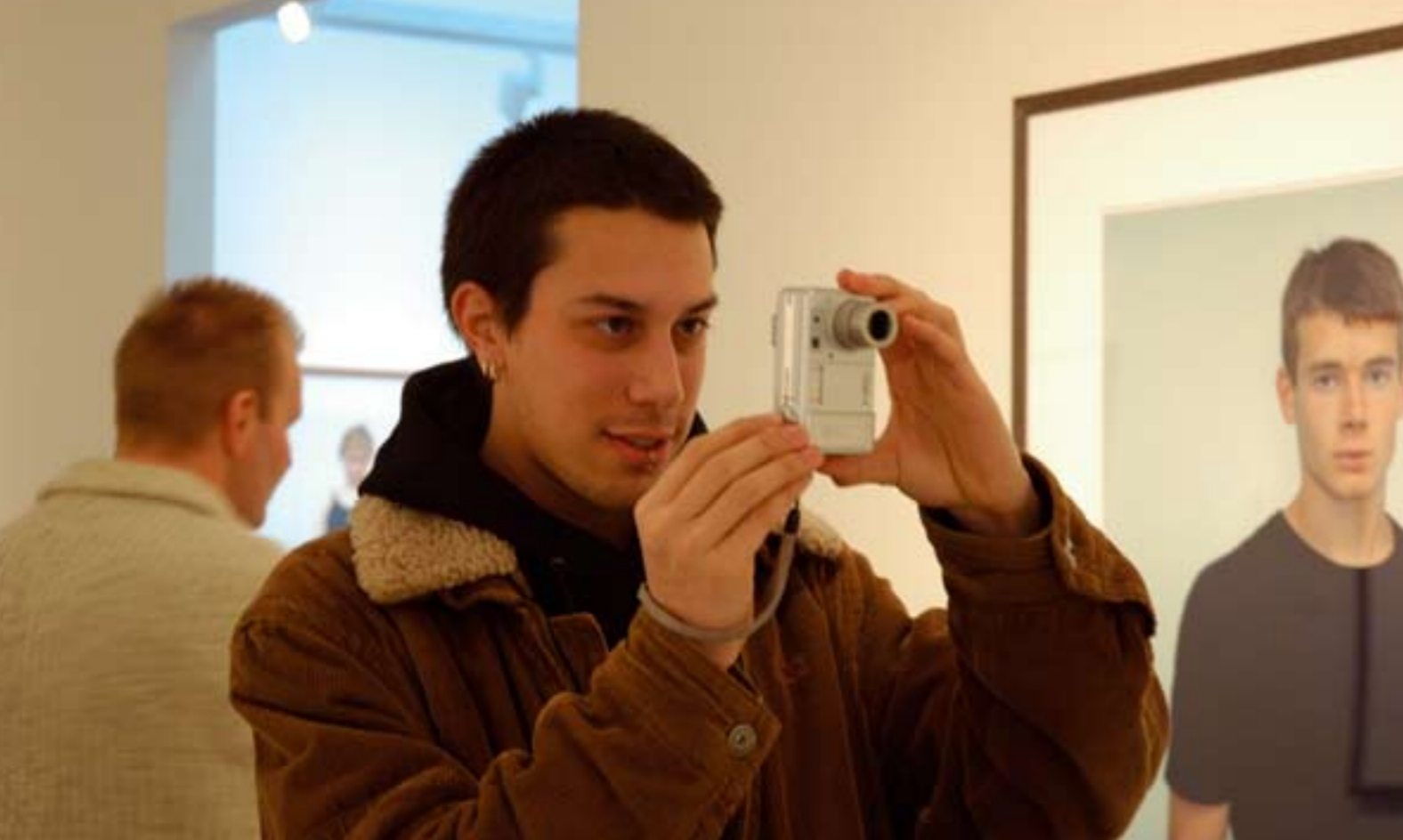
Maakt een andere manier van kunstbeleven Nieuwe Kunst? Fotograaf Saskia van der Linden uit de serie Kijken & Kijken: Kijken 3

cussies en standpunten over wat wel of geen kunst is, geen kwaliteitsdiscussies; het lijkt heel aantrekkelijk. Maar het botst met het voorgaande en omdat, zoals ook Appiah stelt, de manier waarop je met kunst omgaat en erover praat altijd de manier is van maatschappelijke groeperingen om zich van een ander te onderscheiden, vraag ik me af of het sympathieke neutraliseren van de begrippen wel tot een gewenst effect zal leiden.