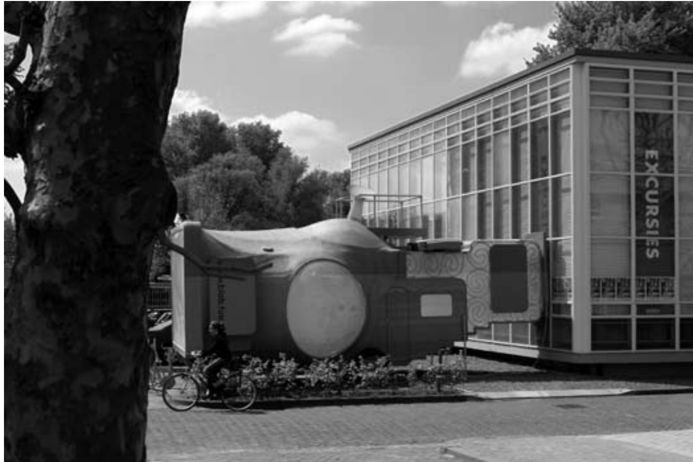
Blob-paviljoen van Studio Jurgen Bey op de campus van TU Eindhoven

onze website. We willen ook een e-magazine gaan uitgeven dat niet zozeer theoretisch is dan wel informatie geeft over kunstprojecten gerelateerd aan de openbare ruimte of urban art tentoonstellingen uit de hele wereld. Het ontwerp van