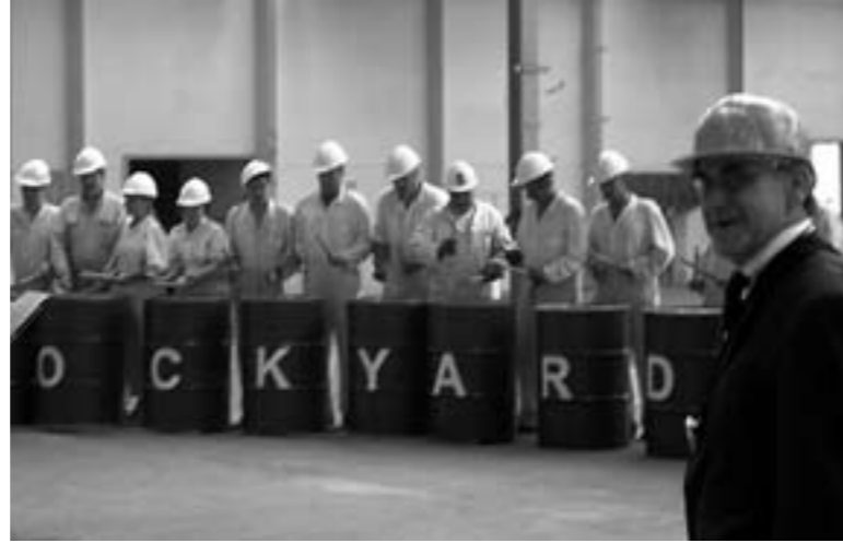
Rotterdams Wijktheater - Verhalen uit de Droogdok

dat het een heel ander fenomeen is, dat ook heel anders beschouwd moet worden dan een museumbezoek.' Voor scholen geeft de database van het Community Art Lab ook per provincie een overzicht van projecten. Leerlingen kunnen hiermee zelf op zoek gaan naar projecten in de eigen omgeving.