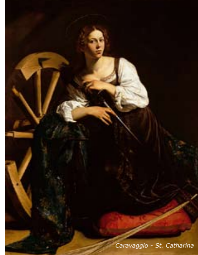
Caravaggio - St. Catharina

Lees het allemaal na op www.mocca-amsterdam.nl > Onderzoek en Trendrapporten > Trendrapport Cultuureducatie 2009.