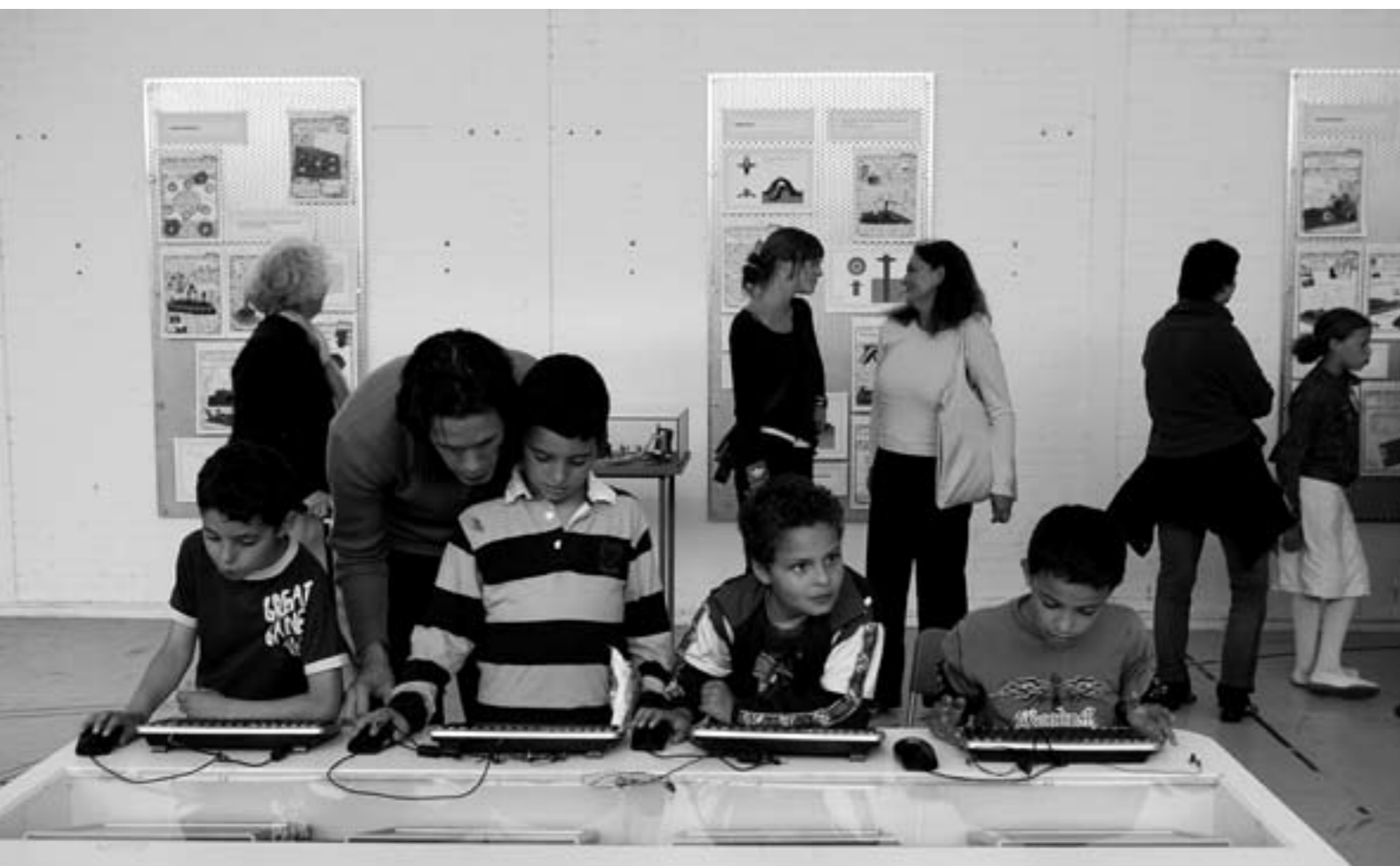
Stedelijklab Face Your World van Jeanne van Heeswijk en Dennis Kaspori

tentoonstellingen volgen we ook academies op zoek naar opkomend talent. Voortdurend volgen we de nieuwe artistieke richtingen op de voet. De kunstenaars worden uiteindelijk door ons uitgenodigd om aan onze projecten mee te werken.