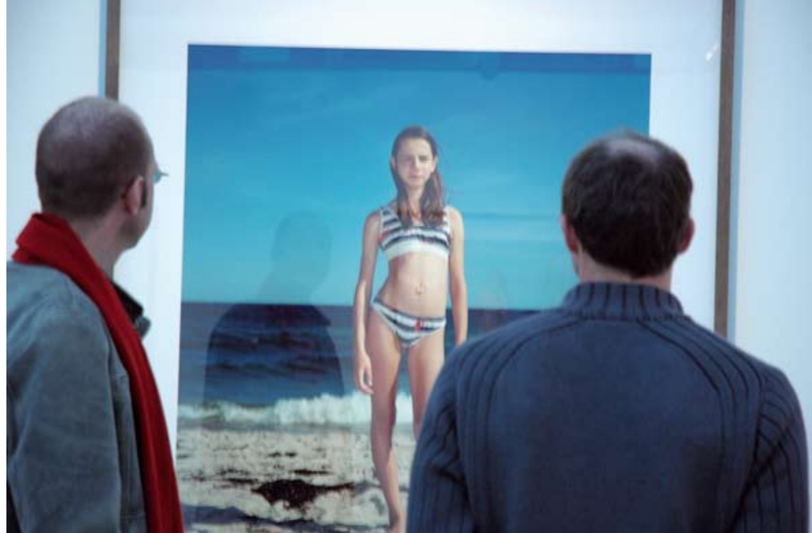
Maakt een andere manier van kunstbeleving Nieuwe Kunst? Fotograaf Saskia van der Linden uit de serie Kijken & Kijken: Kijken 1

'Hoge kunst spreekt mijn leerlingen niet aan, daarmee jaag ik ze voorgoed van de kunsten weg.'