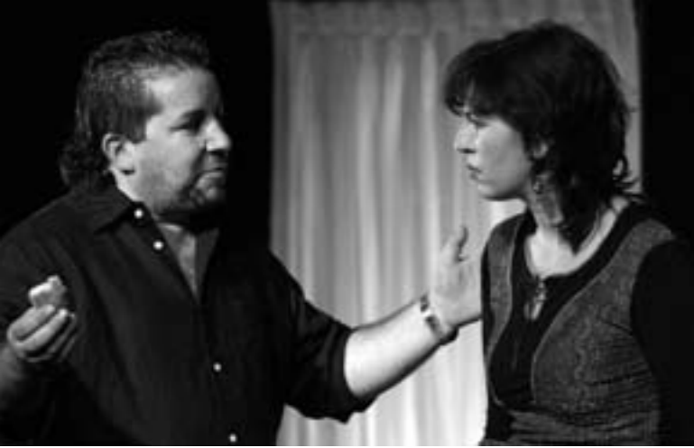
Stut Theater - Theater à la Turca