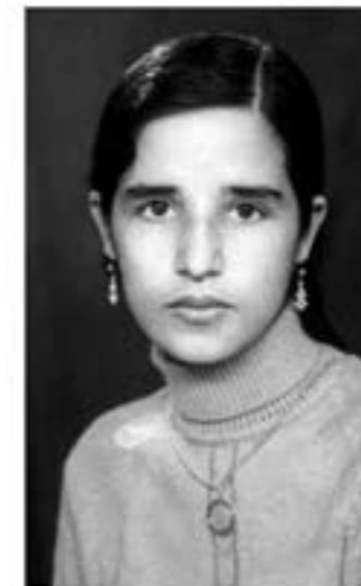
Dubbelbeeld uit het boek

Als de helpdesk onbemand is, kunt u het antwoordapparaat inspreken. Dan wordt u zo spoedig mogelijk teruggebeld.