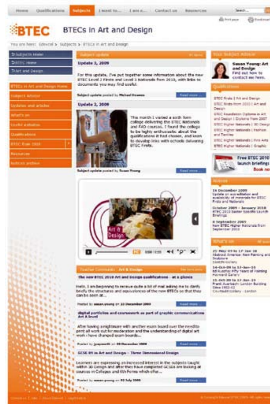
BTEC's in Art and Design op de website van Edexcel

den en beeldelementen. Reflectie op eigen werk en op werk van anderen is een vast onderdeel van iedere opdracht. De kwaliteit van het programma wordt gewaarborgd doordat de interne gecertificeerde beoordelaars het werk van collega's beoordelen. Bovendien vindt er ook een externe controle plaats door een beoordelaar van Edexcel uit Londen.