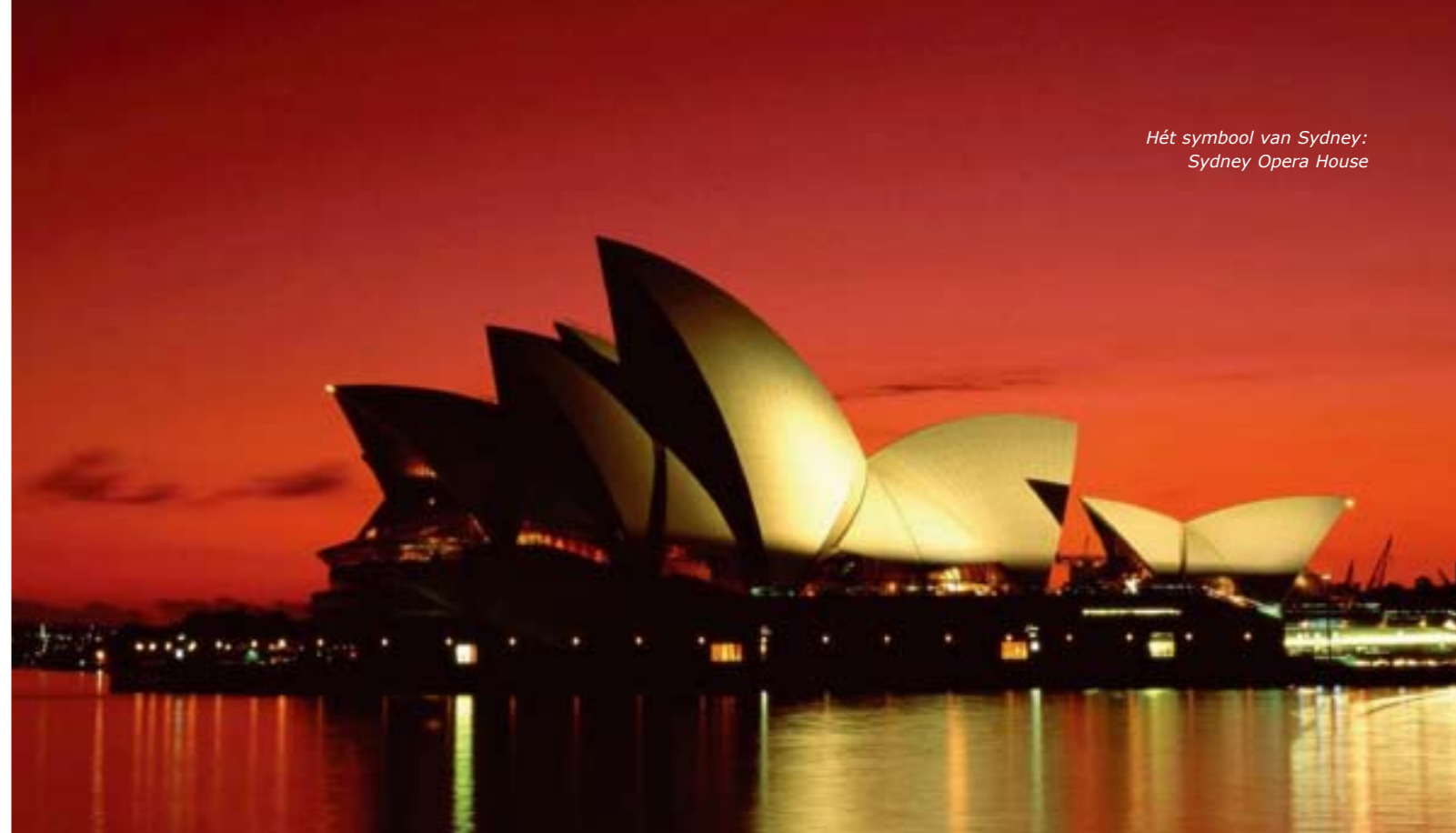
Hét symbool van Sydney: Sydney Opera House

Welnee. Als je andere vormen van entertainment kunt betalen, kun je ook een operabezoek betalen. Open je browser en ga voor het Opera Magazine naar www.martinemussies.nl/opera.pdf en lees de tips.