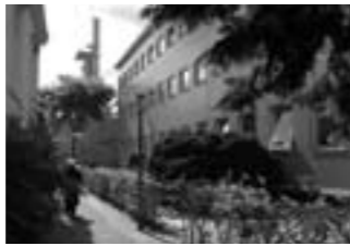
Muziekcentrum van de Omroep