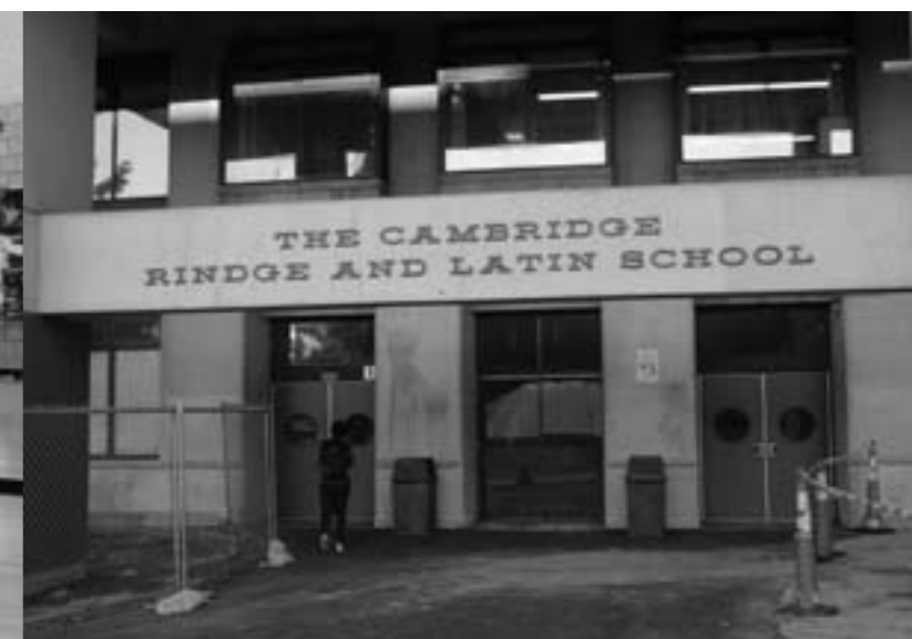
Ingang van de school