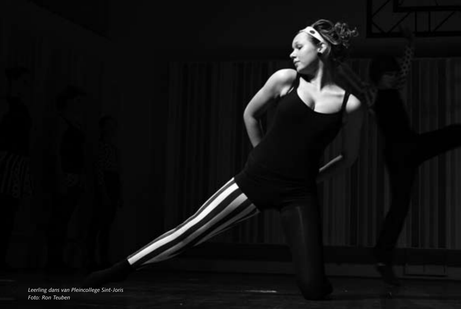
Leerling dans van Pleincollege Sint-Joris