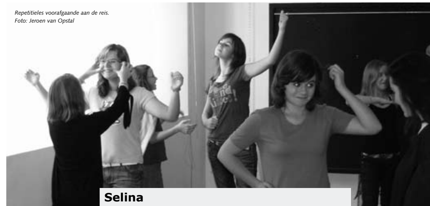
Repetities voorafgaande aan de reis.

Goese Lyceum werd een groot succes. Deze cultuurprofielschool bezit in Goes twee vestigingen. Behalve de locatie Van Dusseldorpstraat met onder meer de kunst- en cultuurklassen is er op locatie Bergweg de VMBO-Theaterschool .