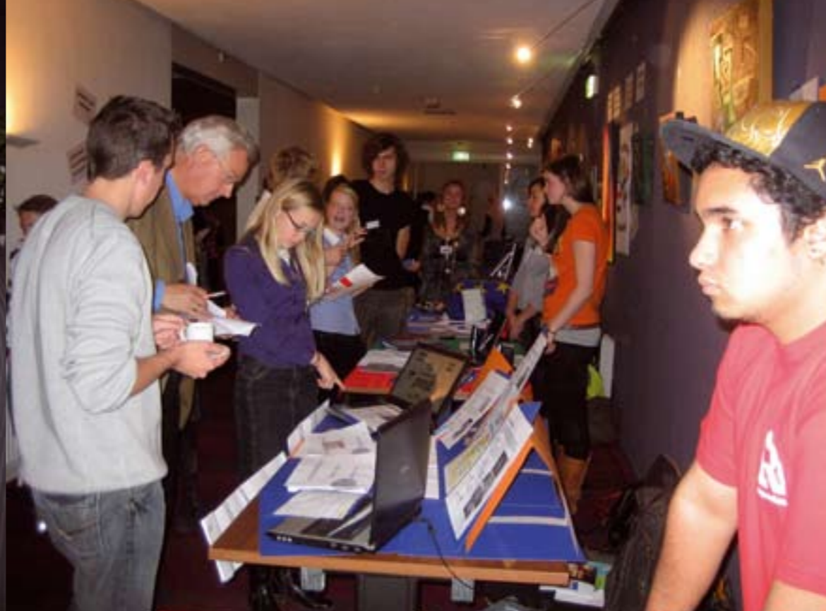
Europees Talenlabel 2008

lingen clips maken. Zij verdiepen zich eerst in een actueel onderwerp, iets dat hun aanbelangt of waar zij zich druk dan wel zorgen over maken. Daarbij gebruiken ze schriftelijke bronnen aan de hand van onderzoeksvragen. Dan bepalen ze wat er in hun clip te zien moet zijn, welke muziek daarbij past en welke tekst er gezongen, gesproken of gerapt moet worden. Ieder onderwerp kan in zo'n clip aan de orde komen: pesten, verdraagzaamheid, vegetarisme, of de werking van holle en bolle spiegels. De onderwijsvernieuwing in de lessen is: zelf iets leerzaams maken op de computer met de middelen beeld, geluid en tekst. En wel zo dat de leerlingen bijna alles zelf doen en de docent adviseert en de kwaliteit bewaakt.