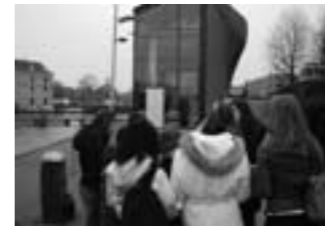
Leerlingen voor ARCAM