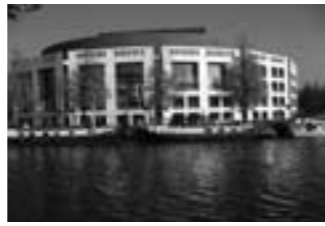
Het Muziektheater Amsterdam