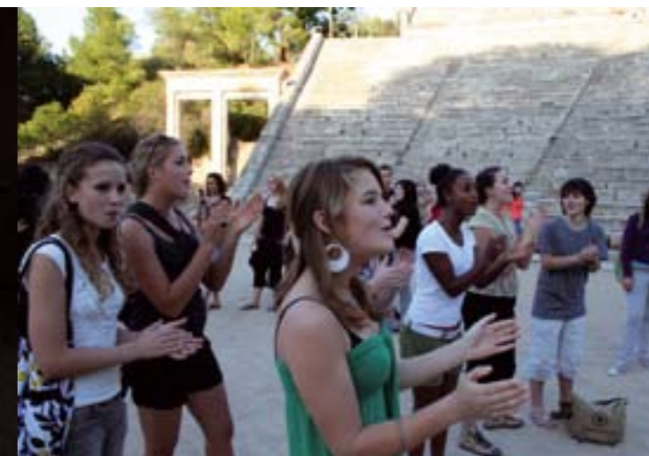
Voorstelling in Griekenland