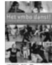
Het vmbo danst!