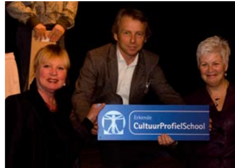
Het KSE Etten-Leur krijgt de titel CultuurProfielSchool

Als een school kiest voor een cultuurprofiel, zal zij moeten aangeven waar zij voor staat en waar de school, vanuit haar ambities, naar toe wil groeien. Een school kan dus binnen een cultuurprofiel kiezen voor verschillende uitwerkingen; zoveel scholen, zoveel scenario's. Een cultuurprofielplan, te vergelijken met een beleidsplan, vormt daarbij de leidraad voor zowel de ontwikkeling als uitvoering van een cultuurprofiel binnen een school. Het expliciteert welke keuzes passen bij je school. Het cultuurprofielplan bestaat uit zes hoofdonderdelen. Deze onderdelen zijn te allen tijde cruciaal binnen een ontwikkelproces naar een cultuurprofiel. De vorm van een cultuurprofielplan kan daarbij verschillen, denk bijvoorbeeld aan een website, een PowerPoint-presentatie, een filmpje of flyer.