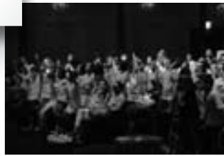
Holland Symfonia