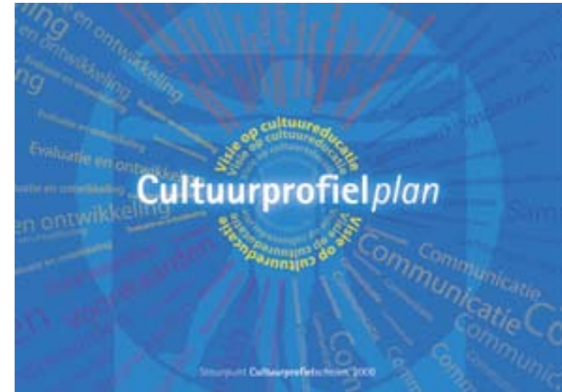
Achterkant kaart Cultuur Leert Anders II

De zes hoofdonderdelen van een cultuurprofielplan met aanverwante subthema's: