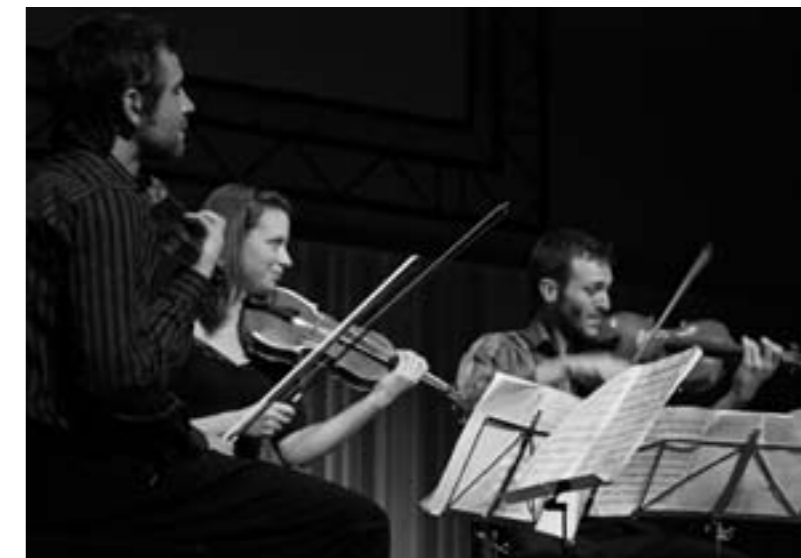
Heath Quartet, finalisten van het romps Concours

De interessante discussies, het optreden van het Heath Quartet , een compositiedansles, 30 brugklassers drama op het podium, veel muziek in de foyer, een fragment uit De Grote Productie , een expositie van beeldende werken en last-but-not-least een bevlogen presentatie maakten het symposium tot een geslaagd evenement. Op de vraag 'Hoe nu verder?' kunnen we na het symposium antwoorden: 'Elkaar vinden en ondersteunen, dus vervolggesprekken organiseren.' Op de vraag 'Wat heeft Eindhoven cultureel talent te bieden?' luidt het antwoord: 'Ontmoetingsplaatsen, veel culturele instellingen en natuurlijk Pleincollege Sint-Joris '.